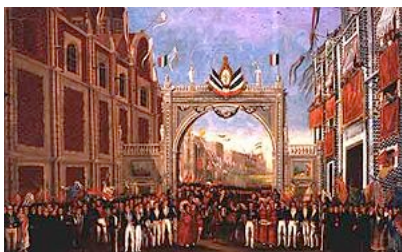
Las primeras décadas de vida independiente fueron muy difíciles para México

Las dos grandes corporaciones que todavía existían en México eran la Iglesia y el ejército, por ello el pensamiento de los reformadores de 1833 tenía un sentido claramente anti corporativista, buscando disminuir la influencia de la iglesia, suprimir el fuero militar, y disminuir el costo y poder del ejército.