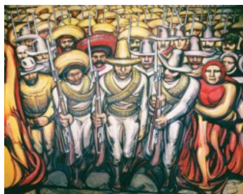
La desigualdad social y las diferencias ideológicas se acrecentaron en esta época